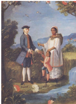
Español e indígena: mestizo