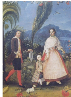
Español y castiza: torna español

Imágenes 3, 4 y 5. Estos fragmentos corresponden a tres escenas de un mismo cuadro de Castas (Escuela Mexicana, siglo XVIII). En la primera escena se ilustra cómo la mezcla de español e indígena produce al “mestizo”. En la segunda escena se representa la mezcla de español y mestiza, origen del “castizo”. En la tercera, cómo la mezcla de español y castiza “torna español”, es decir, que su descendencia se vuelve de nuevo “española”. Esto evidencia la posibilidad de un blanqueamiento secuencial cuando las y los mestizos e indígenas se unían con descendientes de españolas y españoles.