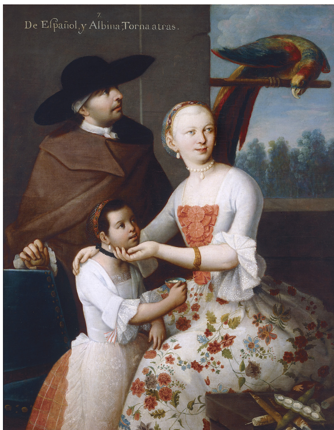
Imagen 6. De español y albina, torna atrás. Pintura de Miguel Cabrera realizada en Oaxaca hacia 1763.