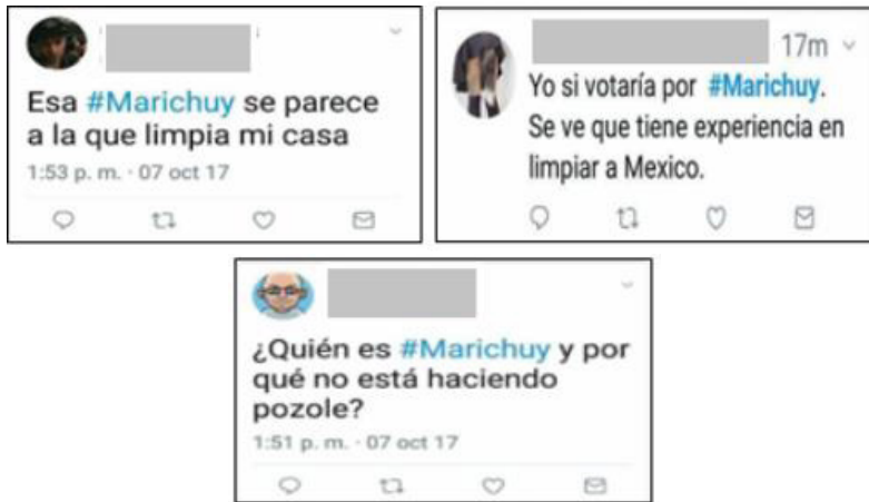
Imagen 9. Tuits racistas dirigidos a Marichuy durante su precampaña en 2018.

Por último, el subcomandante Moisés del EZ señaló otra expresión de racismo pocas veces percibida y mucho menos discutida: