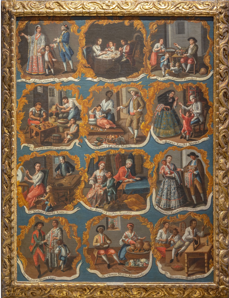
Imagen 2. Esta pintura de la Escuela Mexicana titulada “Doce escenas de castas” fue realizada en el siglo XVIII para mostrar la diversidad de la población novohispana.