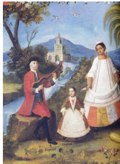
Español y mestiza: castizo