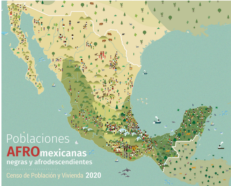
Imagen 10. Mapa de las poblaciones afrodescendientes elaborado por el INEGI con base en el Censo de Población y Vivienda 2020.

En el contexto mexicano “la afrodescendencia se experimenta de diversas formas y difícilmente se puede hablar de una identidad afromexicana homogénea” (Velázquez e Iturralde, 2016a: 234). La identidad afrodescendiente es