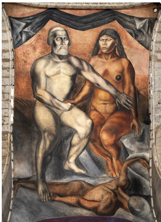
Imagen 8. José Clemente Orozco, 1924.

Fragmento de mural ubicado en el Antiguo Colegio de San Ildefonso, Ciudad de México.