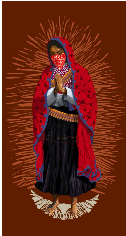
Imagen 7. “Lupe Zapatista”. Obra original de Carlos Andrés Solís Hay.